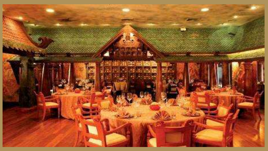
The Spice Route