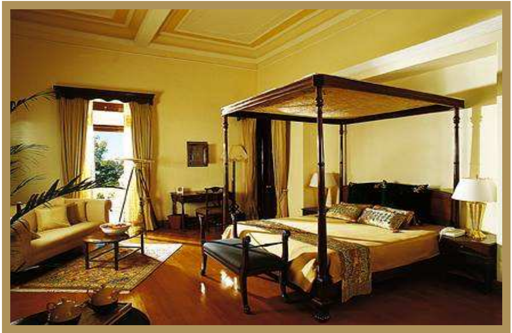
Valley View Room