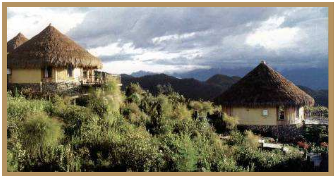
The Baliem Valley Resort

Das Abendessen wird Ihnen im Hotel serviert.